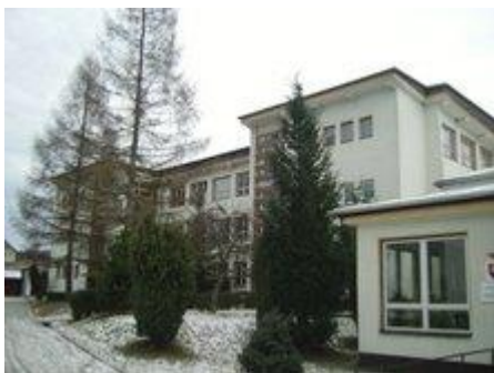
Základná škola Štefana Závodníka