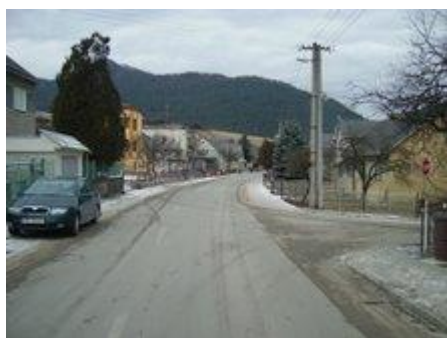
Cesta č. III/06150 Pružina – Považská Bystrica

Komunikačnú kostru riešeného územia tvorí cesta III/06150 a miestne komunikácie. Celková dĺžka miestnych komunikácií je 10,4 km. Najbližšia železničná stanica sa nachádza v Beluši a v Považskej Bystrici.