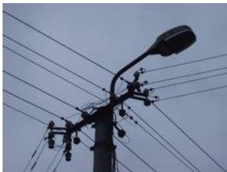
Elektrifikácia v obci

Obec Pružina je elektrifikovaná na 100%, vedenie je nadzemné. Verejné osvetlenie obce nie je na požadovanej úrovni, pravidelne si vyžaduje údržbu. Priebežne sa staré svietidlá zamieňajú za výkonnejšie a úspornejšie. V obci je verejné osvetlenie výbojkové aj žiarivkové. Celkovo je asi 150 žiaroviek s príkonom 100 W. Osvetlenie je vedené po betónových stĺpoch, len ojedinele po drevených.